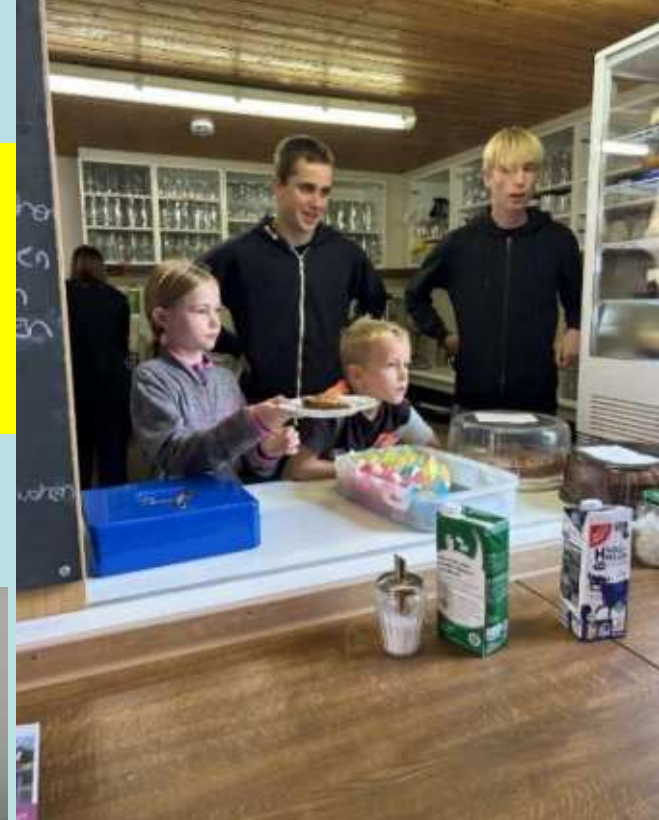
Familiengruppe der OG Sulzbach/Murr