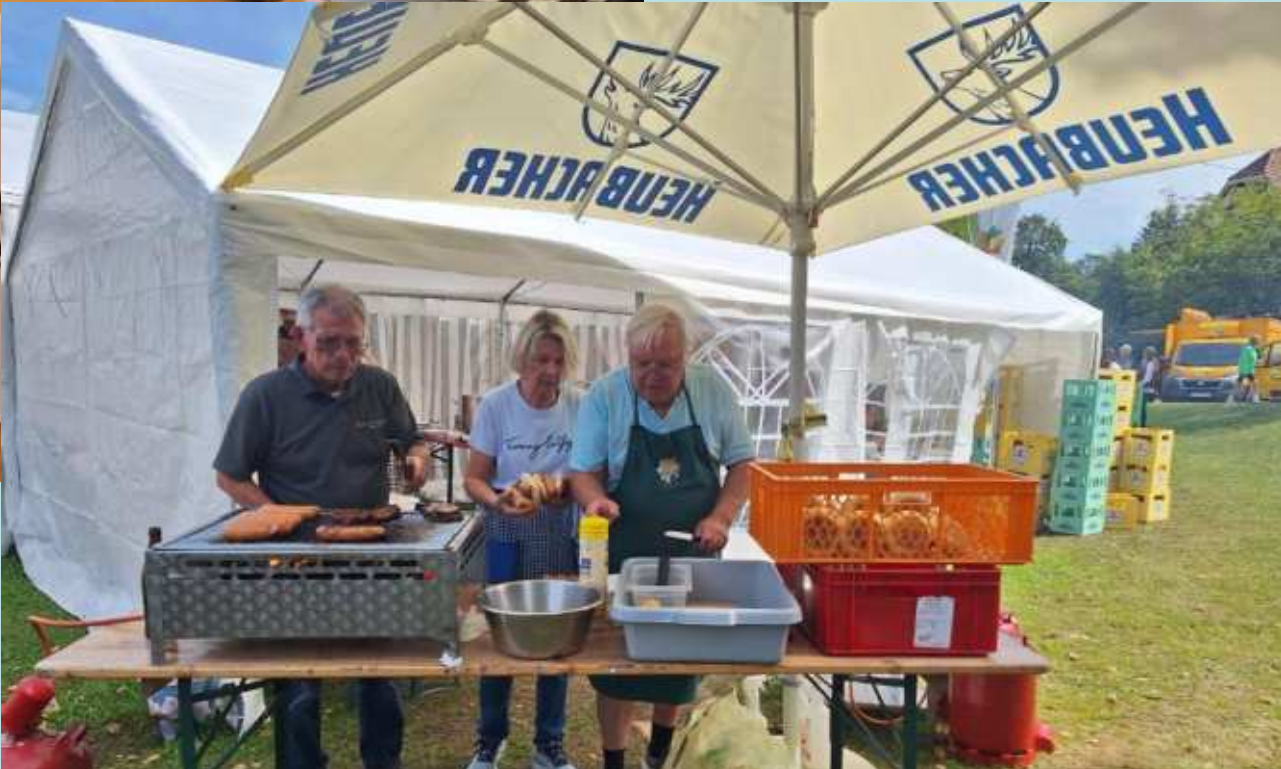
Service team der Eschelhoffreunde