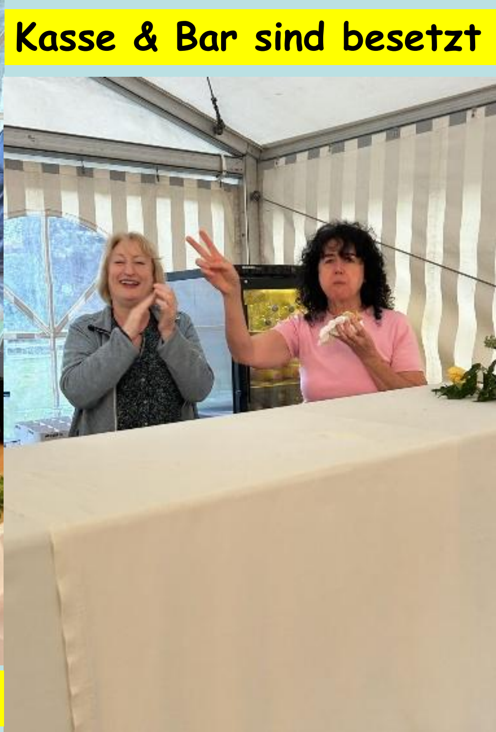
Kasse & Bar sind besetzt