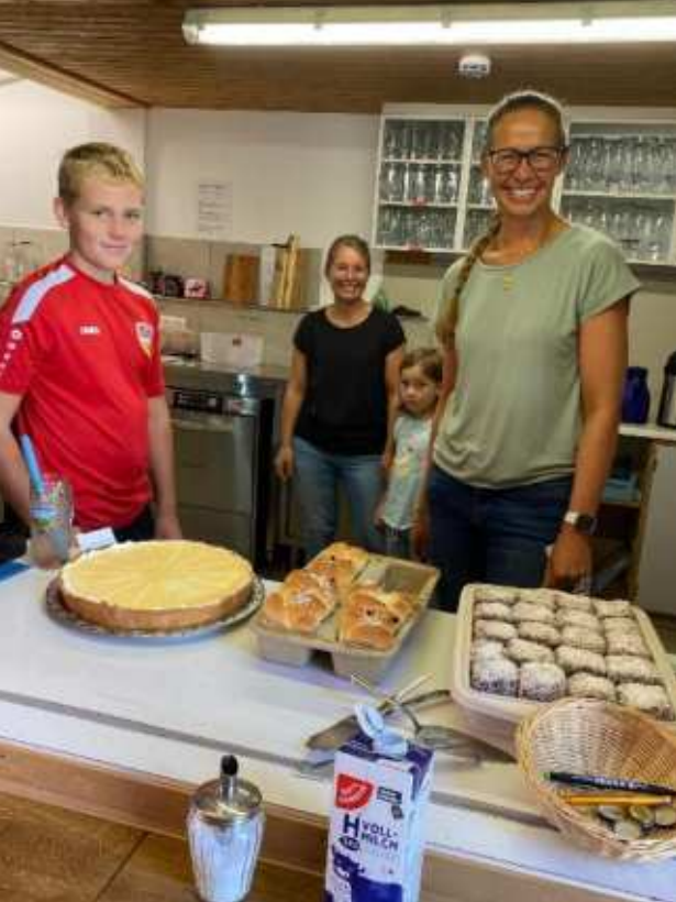
Klasse 5 Lautereck Realschule Sulzbach/Murr