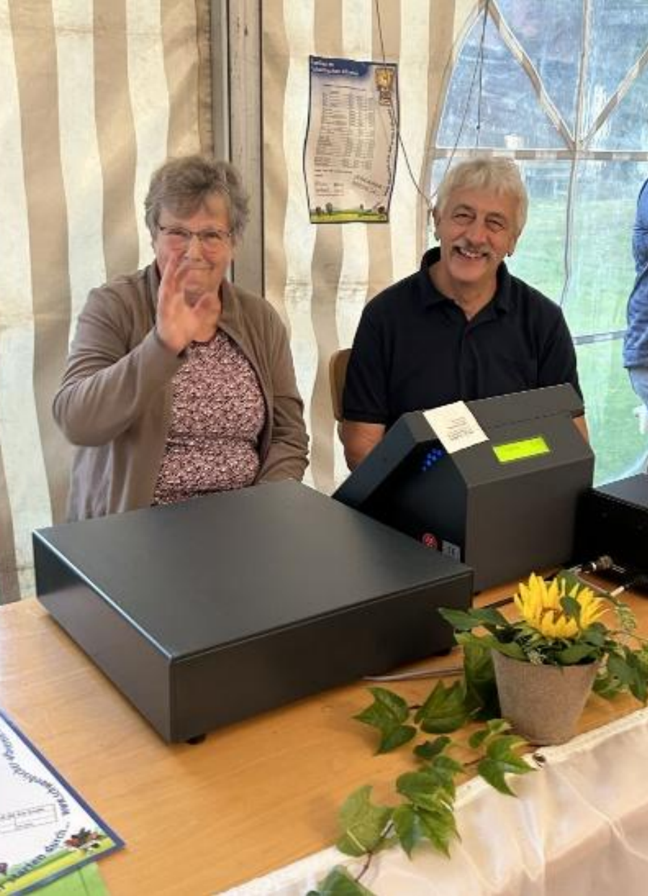
Die Party kann losgehen