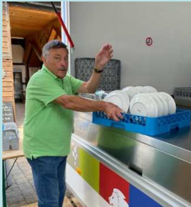
„Der Herr“ des Spülmobils